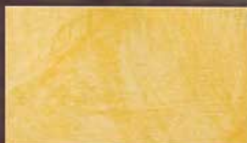
Siena Antica perlucida perlucous