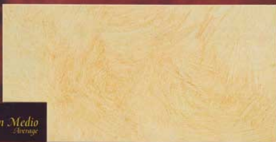
Rytlon Medio Average