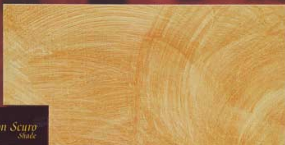
Rytlon Scuro Shade