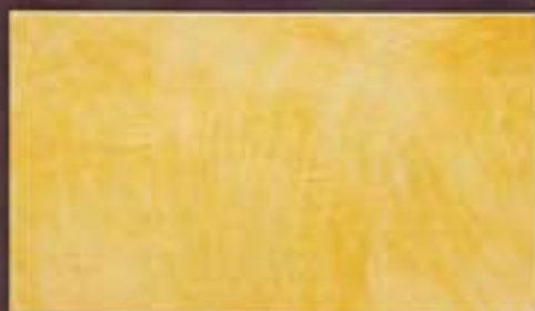
Siena Antica lucida glossy