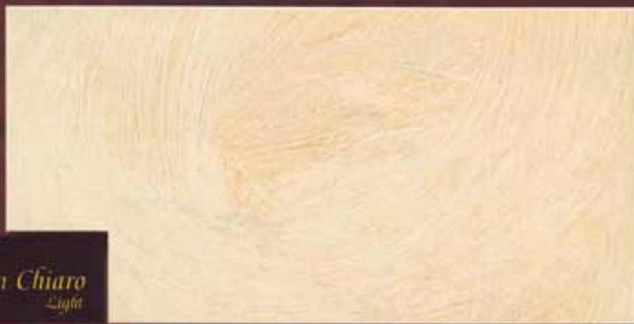
Rytlon Chiaro Light