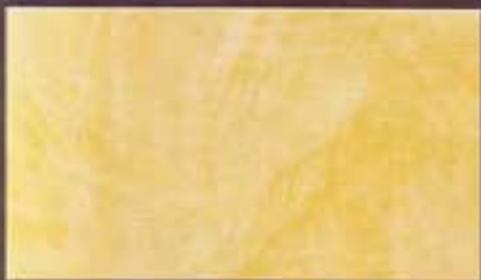
Siena Antica opaca dull

Siena Antica is available in dull, glossy and perlucous versions.