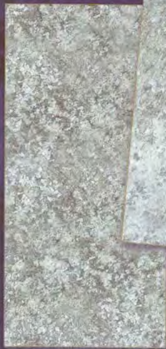
Satre Scuro dark shade

Every colour is endowed with its own expressive and spiritual worth and as a consequence, it has the power to transmit and portray spiritual reality as well as any objective allusion.