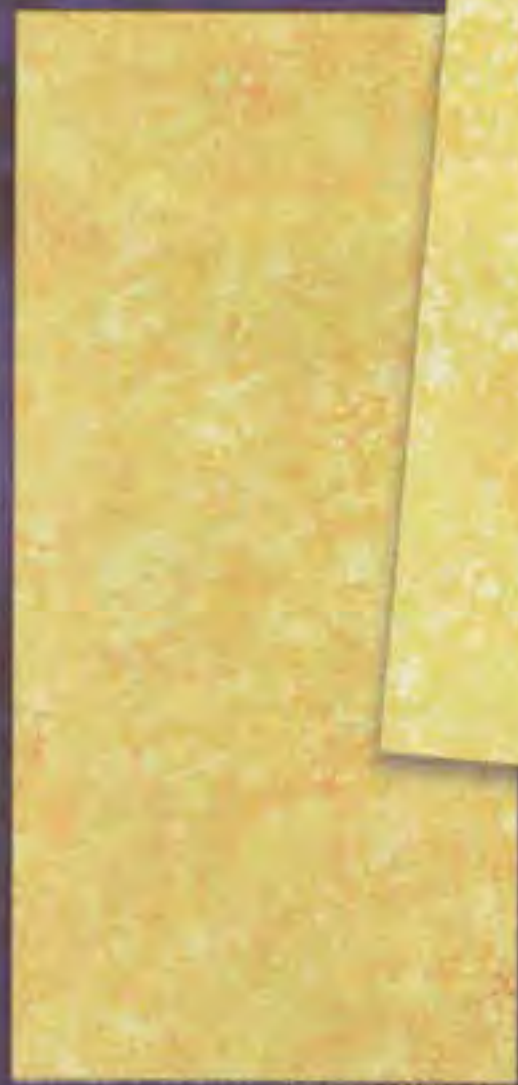
Turan Scuro dark

Creativity seems to be the dialogue between both sides of the brain.