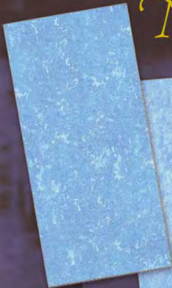
Nevvuns Scuru streak