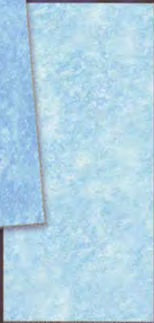
Nevvuns Chiaro light

Oggi viviamo nel colore, il suo ruolo da protagonista spesso riesce a superare la parola con la forza del suo impatto.