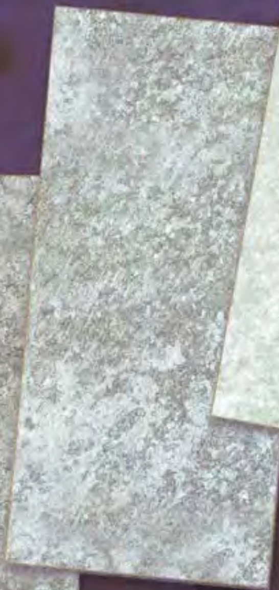
Satre Medio average