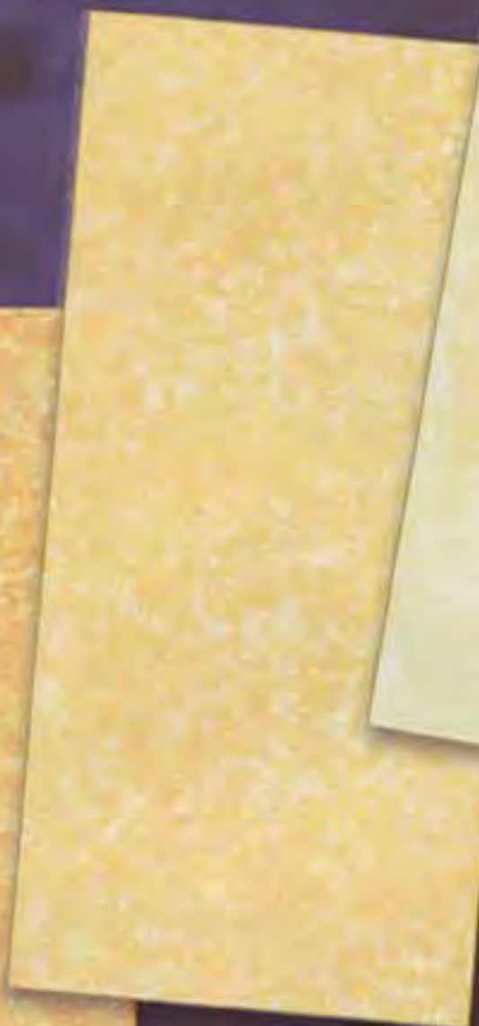
Saflans Medio average