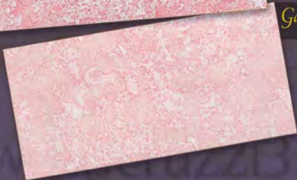
Gades Chiari light