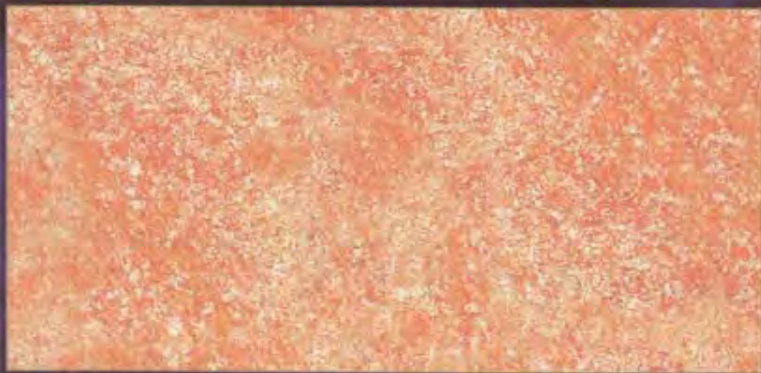
Imperium Scuro shade