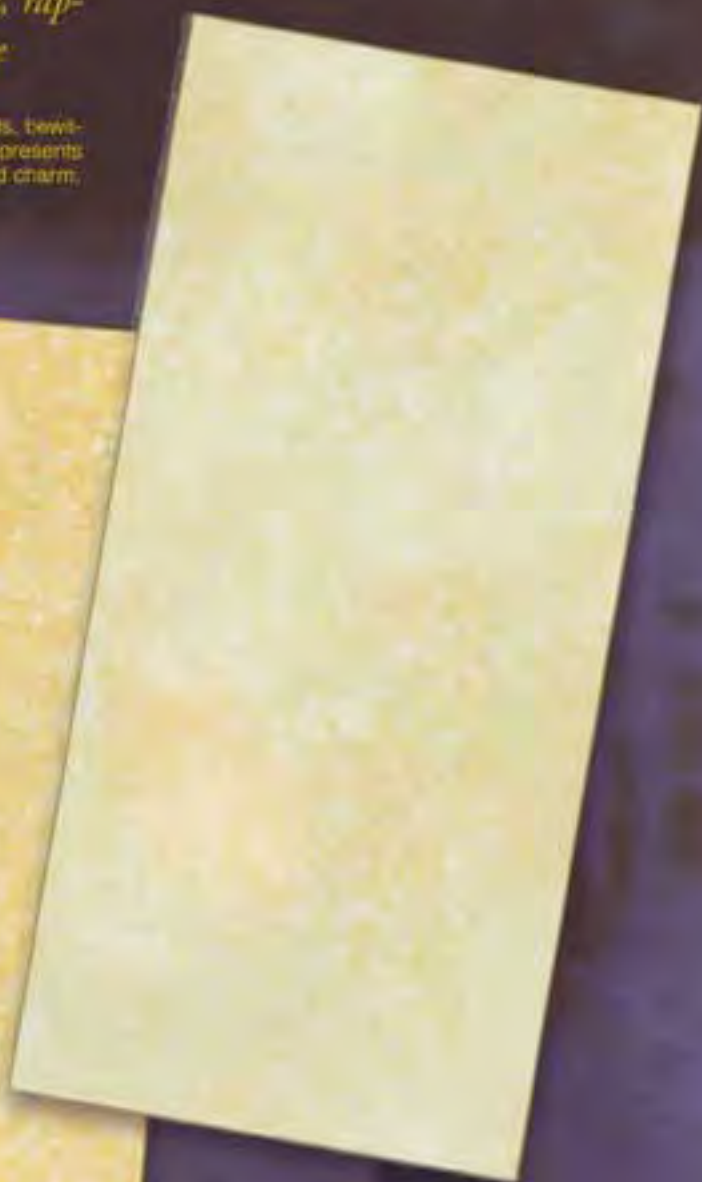
Saflans Chiaro light