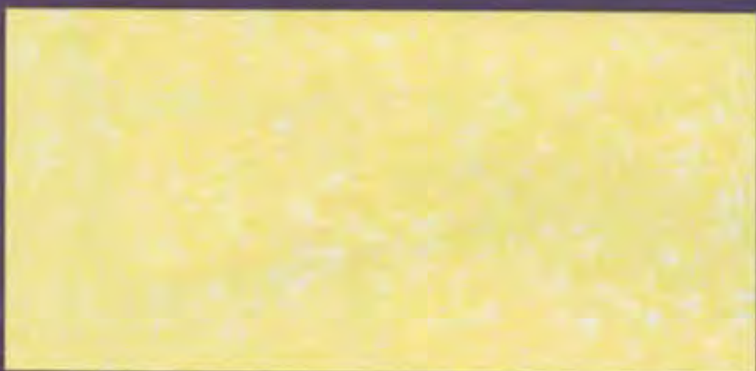
Canva Medio average