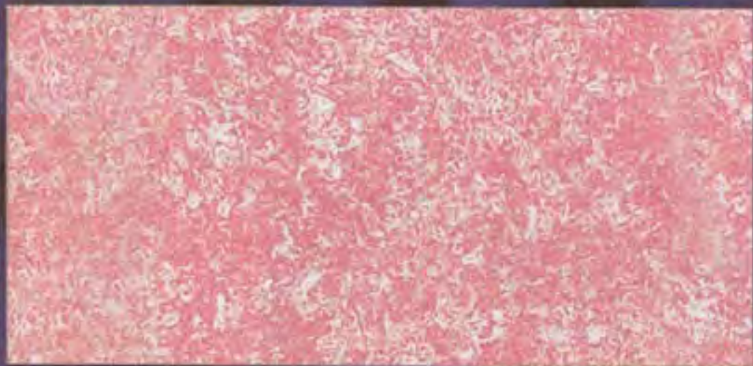
Gades Scuri shade

The colour entwinds our life. If suddenly everything became white and black the anguish of not to be would prevail and it would recall the colour to feel again the life's awareness.