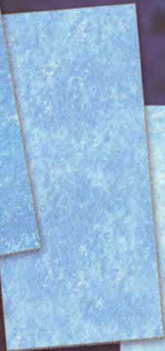
Nevvuns Medio average