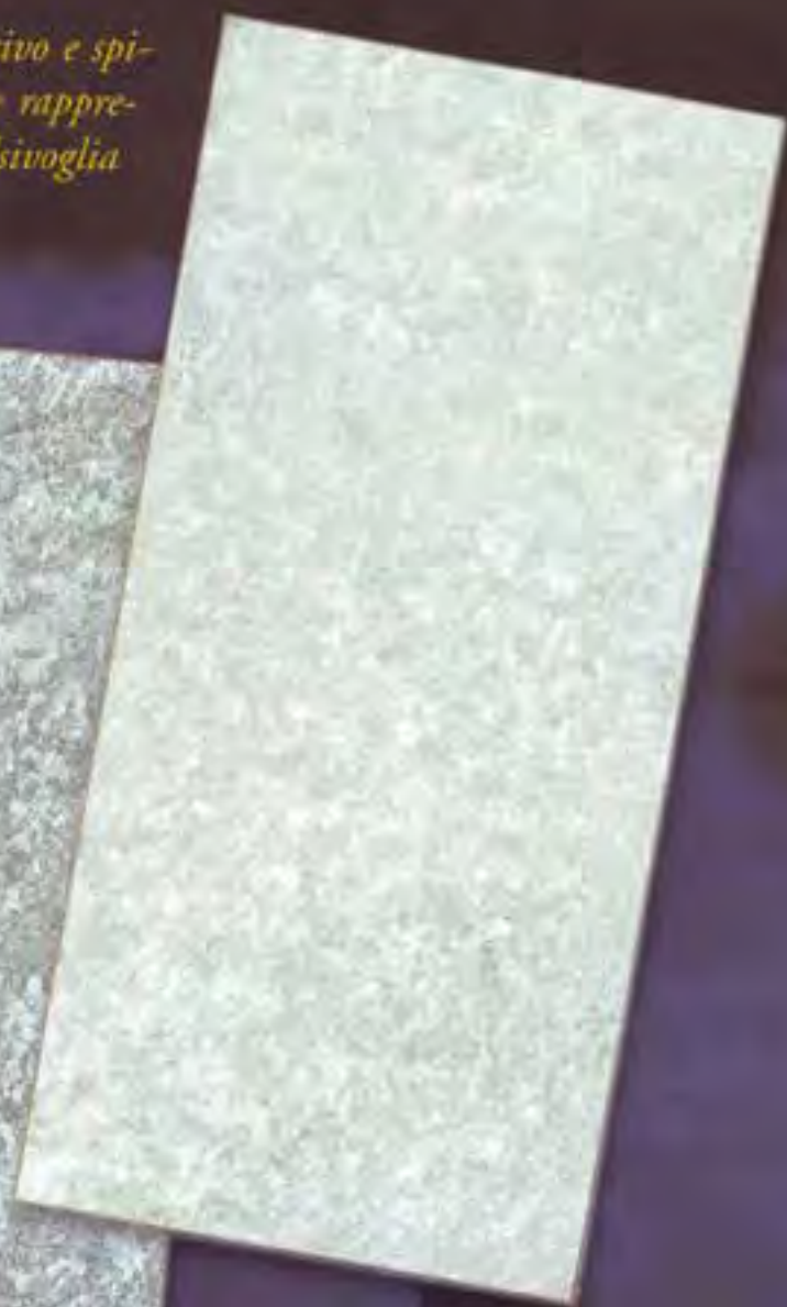
Satre Chiaro light