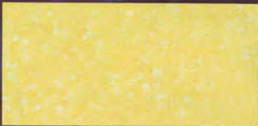
Canva Scuro shade