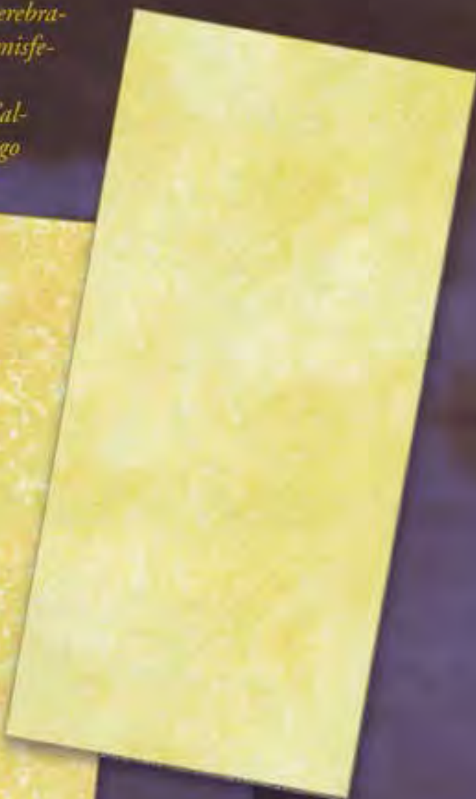
Turan Chiaro light