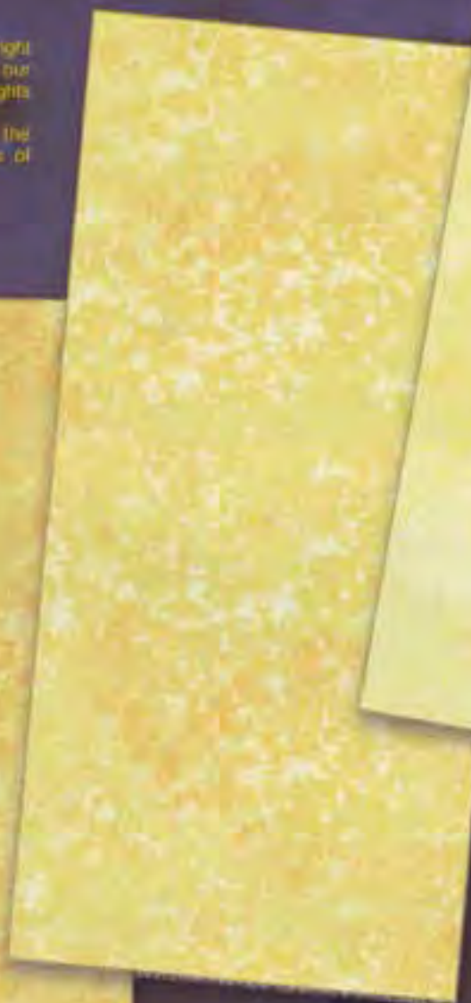
Turan Medio average