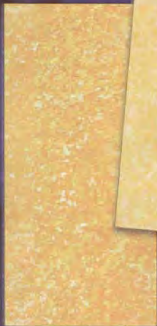
Saflans Scuro dark

Colour conquers, fascinates, enchants, bewitches, surprises and excites us; it represents the laws of change and of seduction and charm.