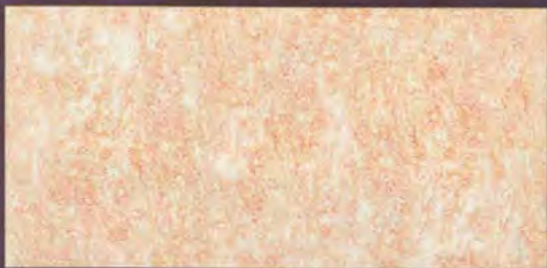
Imperium Chiaro light

Il colore ha un'indiscussa capacità di stimolare i nostri sensi stuzzicandoli e risvegliandoli; lo percepiamo in maniera soggettiva e il nostro rapporto con "lui" diventa molto personale e unico.