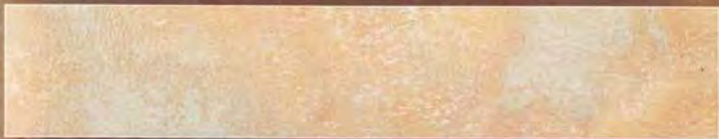
Rosso Ossido Medio Oxidized Red average

2,5 lt Le Gemme di Siena + 375 ml Naturia Rosa + Luce Oro