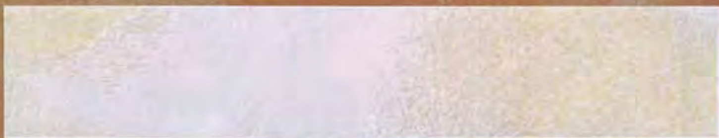
Viola Medio Violet average

If you study walls customised with the Luce Oro it causes subtle pleasure; they ooze the vivid, bright noise of colour that is evident in the environment around us.