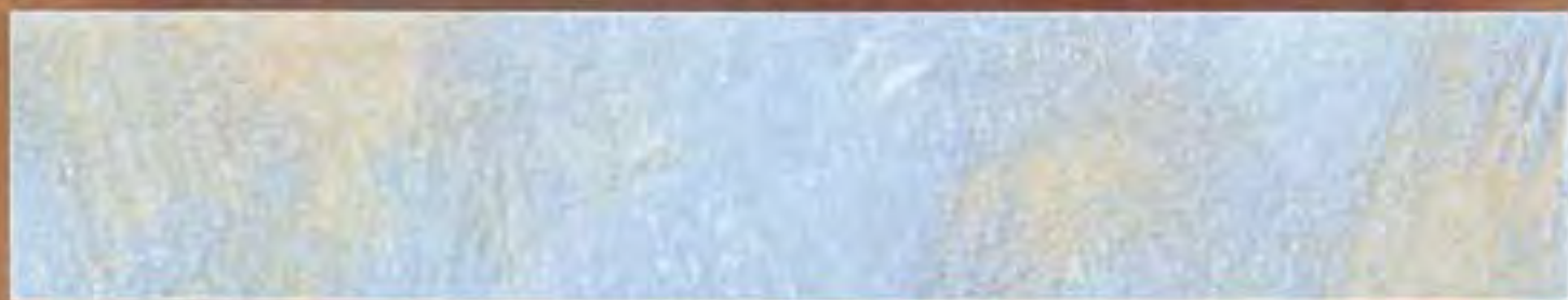
Blu Medio Blue average

2,5 lt Le Gemme di Siena + 375 ml Naturia Viola + Luce Oro