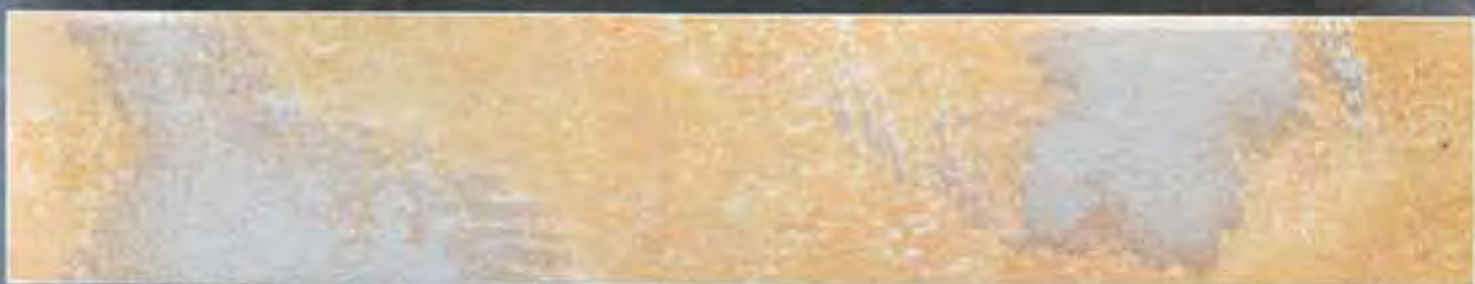
Rosso Ossido Medio Oxide Red average

2,5 lt Le Gemme di Siena + 375 ml Naturia Rosa + Luce Argento