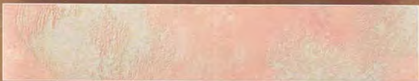
Rosa Medio Pink average

2,5 lt Le Gemme di Siena + 375 ml Naturia Ocra + Luce Oro