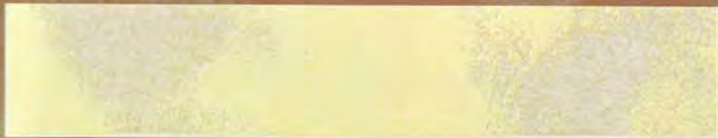
Giallo Medio Yellow average

2,5 lt Le Gemme di Siena + 375 ml Naturia Giallo + Luce Oro