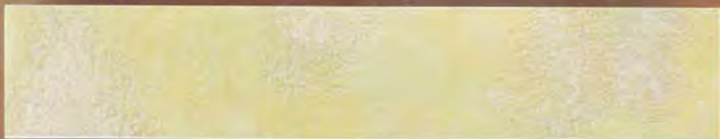
Ocra Medio Ochre average

2,5 lt Le Gemme di Siena + 375 ml Naturia Rosso + Luce Oro