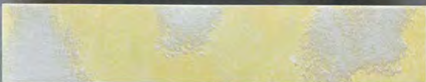
Ocra Medio Ochre average

2,5 lt Le Gemme di Siena + 375 ml Naturia Rosso + Luce Argento