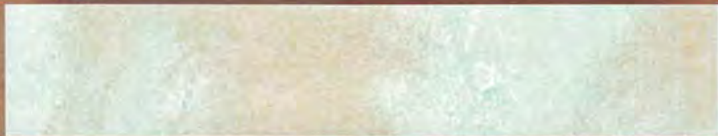
Verde Chiaro Green light

2,5 lt Le Gemme di Siena + 375 ml Naturia Blu + Luce Oro