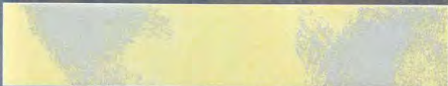
Giallo Medio Yellow average

2,5 lt Le Gemme di Siena + 375 ml Naturia Giallo + Luce Argento