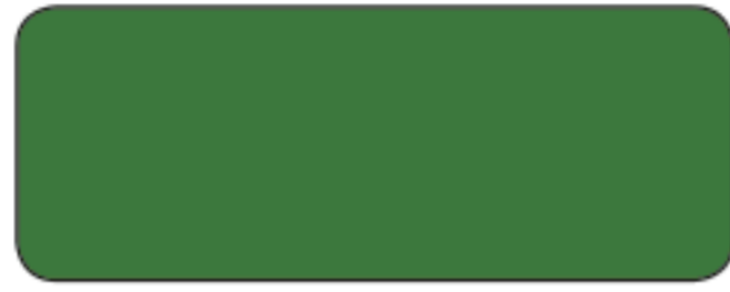
M 230 / RAL 6001 VERDE SMERALDO