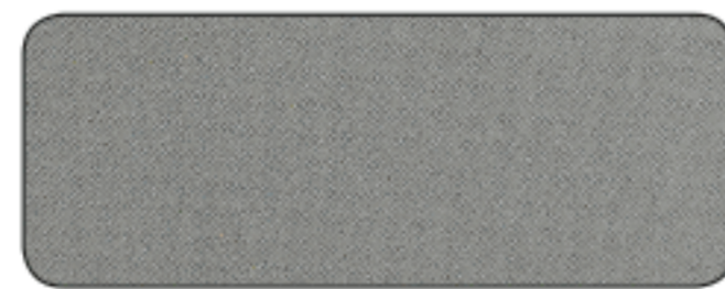
E 940 CROMO SPECCHIO