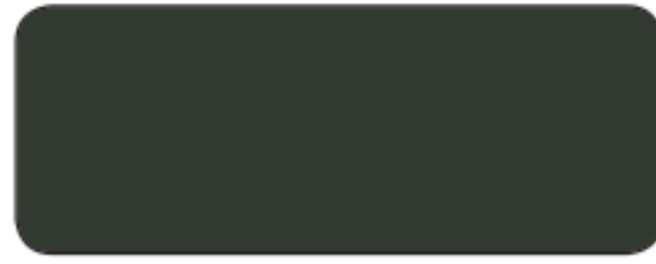
M 250 / RAL 6006 VERDE MUSCHIO