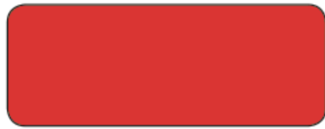
E 944 ROSSO