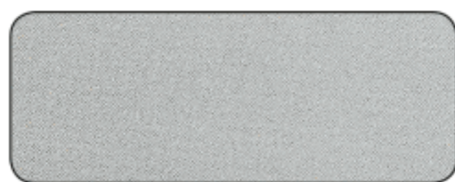
T 401 ALLUMINIO