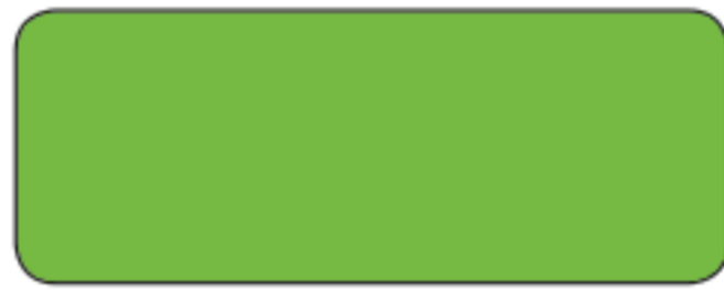
E 946 VERDE