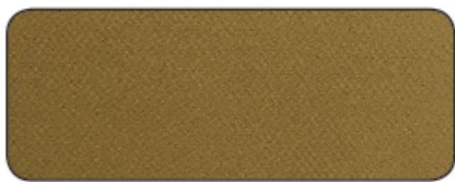
E 941 ORO SPECCHIO