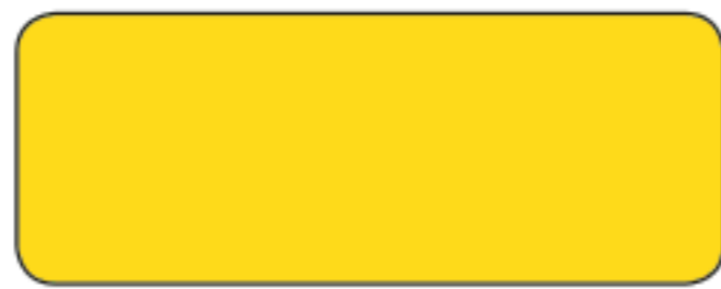
M 135 / RAL 1021 GIALLO NAVONE