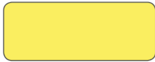
E 945 GIALLO