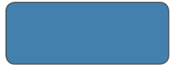
M 200 / RAL 5012 BLU LUCE