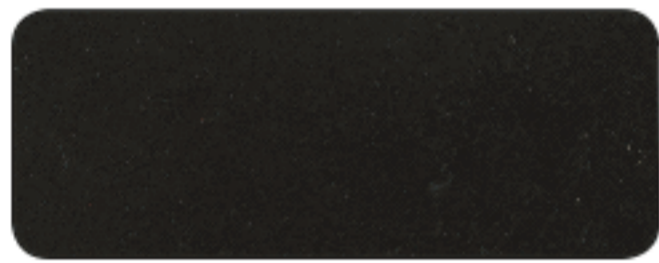
E 500 ANTRACITE