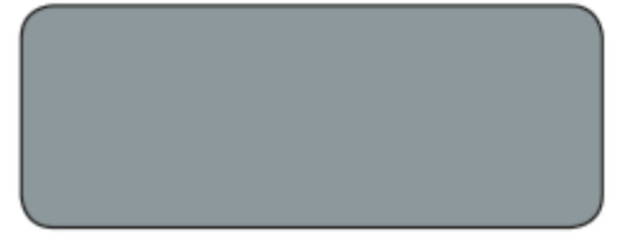
M 270 / RAL 7001 GRIGIO ARGENTO