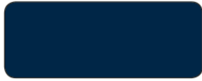
M 220 / RAL 5013 BLU COBALTO