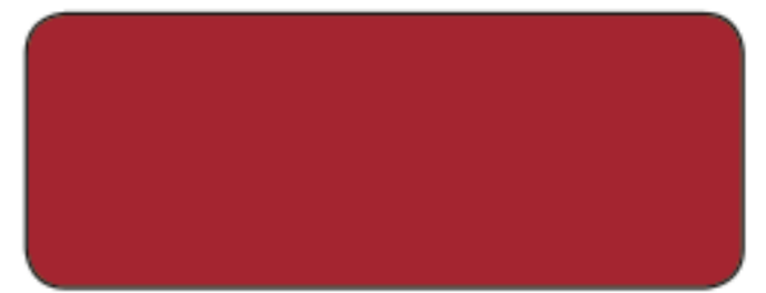
M 170 / RAL 3001 ROSSO SEGNALE