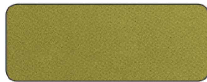
E 933 ORO RICCO PALLIDO