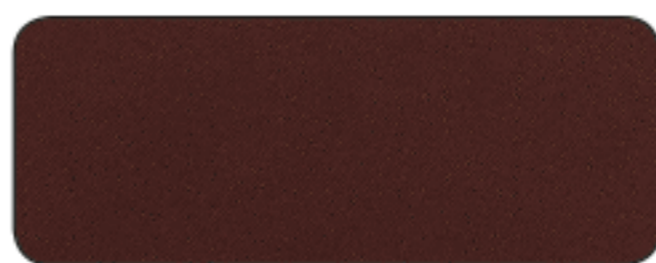
T 404 ROSSO FRENI